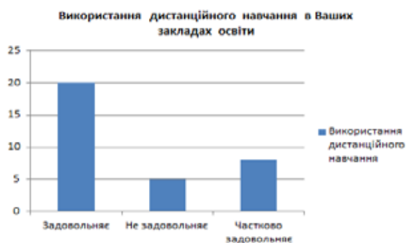
Рис. 1. Відповіді респондентів щодо задоволеності процесом дистанційного навчання

Відповідь «Частково задовольняє» мала розширену відповідь, де викладачі відмітили, що розвиток сучасних технологій не лише значно розширює можливості для досліджень у всіх сферах, а ще розкриває можливості для плагіату, фабрикації, фальсифікації. Викладання онлайн не буде кращим за традиційне, доки викладачі не почнуть застосовувати ефективні методики викладання – ті, що мають наукове підґрунтя. Це дуже важливо для забезпечення якісної освіти.