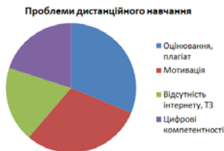
Рис. 2. Відповіді респондентів щодо проблем дистанційного навчання.

І останній блок питань був направлений саме на виявлення які цифрові інструменти використовуються найбільш ефективно та які мають широке застосування викладачами (рис. 3).