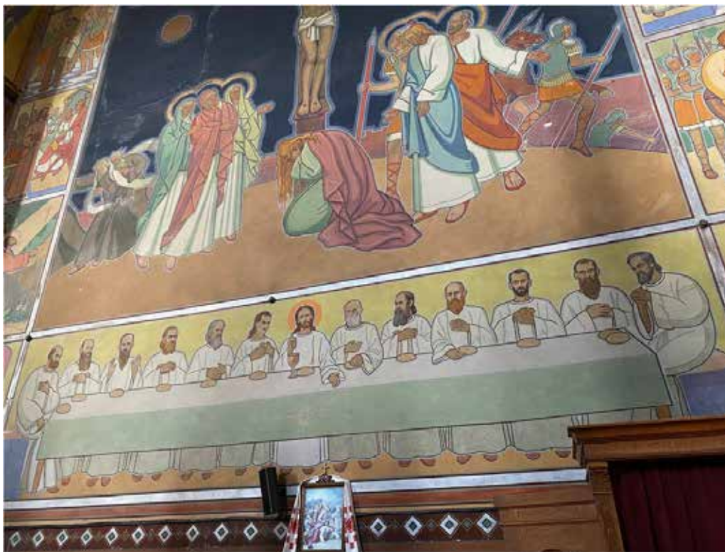
Рис. 1. Тайна вечеря. Розпис церкви Різдва Христового (1911–1939 рр.), Жовква

Христа як образ, що смиренно приймає призначену йому долю. Натомість більш експресивний підхід демонструє Осип Сорохтей у своєму виконанні Страсного циклу (серія 1930–1932 рр.). Його роботи вирізняються графічною манерою, а також експресією. У деяких сценах фігуру Христа складно вирізнити з натовпу людей, які супроводжують його на Голгофу. На основі аналізу творчості згаданих митців першої третини ХХ століття можна зробити висновок, що в зображенні Христа у Страсному циклі значну роль відіграють різні фактори: чи то церковне замовлення, чи мистецькі пластичні пошуки, чи прагнення розповісти про особисті переживання або аспекти життя художника.