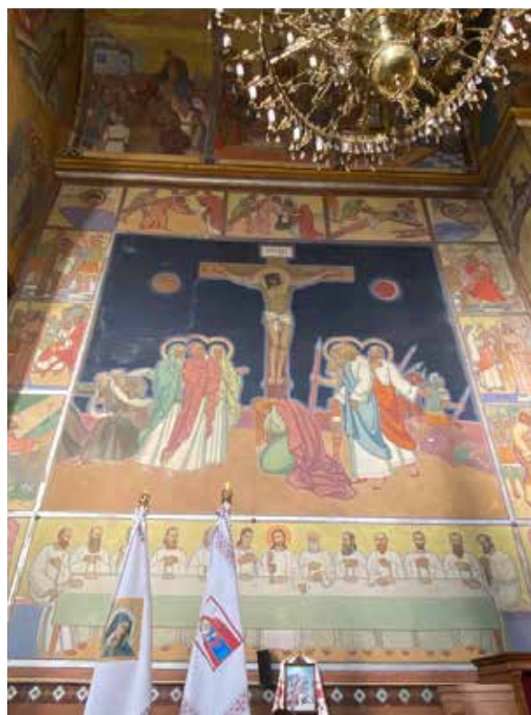
Рис. 1. Страсний цикл. Розпис церкви Різдва Христового (1911–1939 рр.), Жовква

XX ст. і намагалися визначити мистецькі феномени того часу в релігійному малярстві. Першість у дослідженні українського художника Ю. Буцманюка у сфері монументального живопису належить дослідниці О. Садовій-Мандюк. У своєму дисертаційному дослідженні «Монументальний церковний живопис Юліана Буцманюка першої половини XX століття» (Садова-Мандюк 2020: 179) авторка зуміла зібрати значну кількість джерел про митця й систематизувати їх у контексті біографічних відомостей. Вона виявила стилістичні ознаки його малярства та провела атрибуцію творів художника, що вдалося ідентифікувати. Важливим внеском дослідниці є ґрунтовний аналіз монументального стінопису художника у церкві Пресвятого Серця Христового (нині – церква Різдва Христового) в місті Жовква. Також слід згадати про дослідницю І. Гах, яка у своїх публікаціях приділяє увагу як біографічним