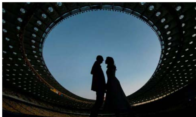
Рис. 2. Сучасний site-specific театр

Примітка: 1 – Вистава «Remote Kyiv», 2 – Спектакль «STEREO»