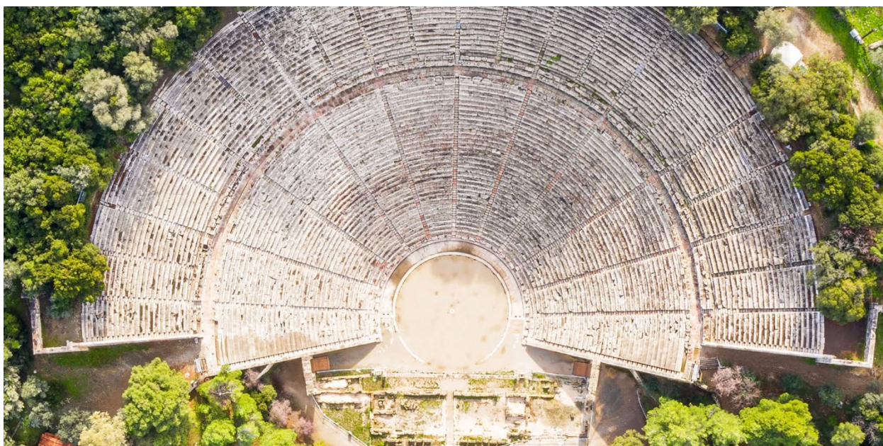
Рис. 1. Античний театр Епідавра

Сценічний дизайн театральної вистави, згідно твердженню Л. Тузової, є результатом логічного, образного мислення та інтуїтивного чуття, вираженого через ідею або центральну тему. Оригінальна організація простору, драматизм, функціональність декорацій та костюмів, мультимедіа, світлове рішення втілюють у пластичне рішення ідею вистави, поставлену режисером (Тузова, 2022: 84). Отже, архітектура простору стає одним