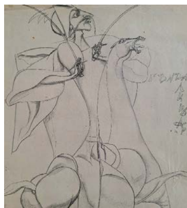
Іл. 5. Стороженко М. А. «Гонта-лицар». 1990-ті рр. Папір, олівець

В інших творах відбувається зближення героїчного доби античності та доби бароко. Як персона доби бароко, Гонти унаочнюється експресією ліній та драматичною урочистістю, характерною для сакралізованих видінь-екстазів в дусі Джованні Лоренцо Берніні, хоча у видіннях необако він постає як лицар зі зброєю верхи на коні (іл. 5, 6). Митець використовує прийом образної деформації для передачі умовної зовнішньої схожості задля правди внутрішнього стану, «портрета душі», переданого колоритом суворой та глибокої палітри з домінантою червоного. Показово, що М. Стороженко доповнює твори написами, традиційними для портретів доби Середньовіччя та Відродження. Такі написи є частиною народних картин, зокрема сюжетів про «Козака Мамаю» (Михайлова, 2005: 113–122). У Стороженка вони слугують своєрідним елементом шрифтової драматургії. Водночас, текстуальні елементи надають творах пластичного ритму, виконують функцію композиційних осей: вертикальні рядки тексту підкреслюють непохитність героїчного духу гайдамацького ватажка Івана Гонти.