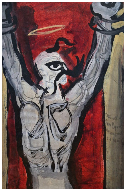
Іл. 1. Стороженко М. А. «Гонта» («Сини мої, сини мої»). 1965 р. Папір, олівець, темпера, туш. 30x20 см. Колекція Романа Петрука

сійні інтереси православних. Високий, ставний, він яскраво виділявся серед людей. Був освічений – вільно володів та писав польською мовою (Ковалевська, 2016: 139–164). Стосунки Гонти з Потоцьким, матеріальна вигода від служби у надвірному війську не позбавили його власних переконань і не зробили його сліпим виконавцем чужої волі. У травні 1768 р. в Умані загони І. Гонти об'єдналися з гайдамацькими силами Максима Залізняка. Більше доби тривав штурм міської фортеці, 10 червня було зламано опір шляхти, орендарів та лихварів, які ховалися від народного гніву за оборонними укріпленнями. На загальній раді Залізняка було обрано гетьманом, Гонту – полковником. На визволеній території був запроваджений козацький устрій, ліквідована панщина (Смолій, 2004: 154).