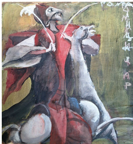
Іл. 6. Стороженко М. А. «Гонта-лицар». 1990-ті рр. Папір, комбінована техніка

Серед композиційних прийомів варто відзначити також дугоподібні елементи, що надають простору ознак тріумфальної арки і водночас церковного склепіння, замикаючи зображуваного в його екзистенції, на межі езотерики, спрямованої на самопізнання у межах прихованих законів Всесвіту, енергії та свідомості (Михайлова, 2016: 175–184).