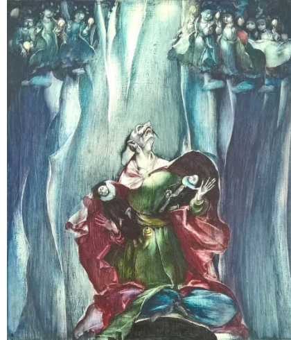
Іл. 2. Стороженко М. А. «Гайдамаки». З серії ілюстрацій до книги «Кобзар» Т. Шевченка. 1985–2004 рр. ДВП, авторська техніка. 42x39,5 см

жений у стані граничної рефлексії. Характерно, що навіть у динамічних композиціях лик героя залишається зосереджено-статичним, нагадуючи обличчя архаїчного куроса-Аполлона (іл. 3). Ця асоціація наближає образ Гонти до рівня античної трагедії, високої грецької класики (Richter, 1960).