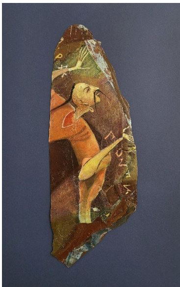
Іл. 3. Стороженко М. А. «Офіра Гонти». 1990-ті рр. Авторська техніка