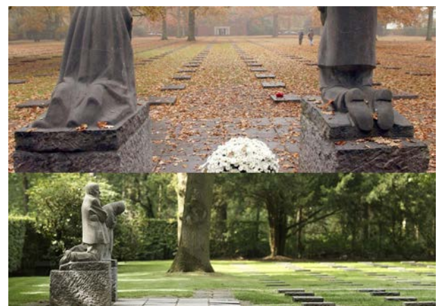
Рис. 6. Німецький цвинтар у Владсло. Скульптурна група К. Колльвіц у ландшафті «Героїчного гаю»

Німецька меморіальна традиція (зокрема в роботах Р. Тішлера) пішла принципово іншим шляхом, спираючись на ідеї містичного романтизму та розвиваючи концепцію «Героїчного гаю» (Heldenhain). На протигагу британському «світлому саду», німецький цвинтар – це інтровертний простір тіні та трагізму (Mosse, 1990). Архітектори відмовлялися від геометричної жорсткості на користь інтеграції в природний ландшафт (висадка дубових гаїв). Використання грубого темного каменю (граніт, базальт) та практика встановлення колективних хрестів (один маркер на кілька поховань) підкреслювали суворість воїнського обов'язку та неподільність бойового братерства (Kameradschaft).