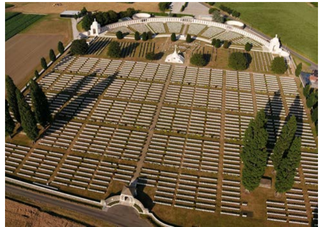
Рис. 5. Військовий цвинтар Tyne Cot. Концепція «The Garden Strategy»

Британська архітектурна школа, очолювана Е. Лаченсом та Р. Бломфілдом, обрала концепцію, що отримала назву «Стратегія Саду» (The Garden Strategy). Її метою було заперечення жахів війни через утвердження вічного життя природи (Geurst, 2010). Британський цвинтар формувався як відкритий, екстравертний простір. Використання світлого портлендського каменю, флористичне оформлення кожної могили та абсолютна стандартизація індивідуальних стел створювали атмосферу урочистості.