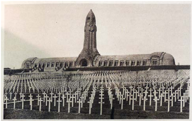
Рис. 7. Осуарій Дуомон під Верденом

Специфічним типологічним відгалуженням цього періоду став осуарій (кісткосховище) – архітектурна відповідь на масову анонімну смерть. Битва під Верденом створила проблему неможливості фізичної ідентифікації сотень тисяч останків. Осуарій Дуомон (арх. Л. Азема та ін.) є унікальним гібридом фортифікаційної споруди, храму та монумента (Prost, 1998). В інтер'єрі цього комплексу архітектура свідомо відмовляється від індивідуалізації простору: це простір тотальної анонімності, де героєм виступає не особа, а маса.