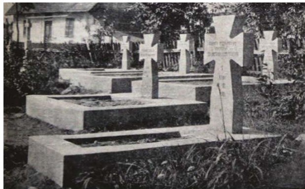
Рис. 8. Бетонний хрест на похованні воїнів УГА

дешево тиражувати складні авторські мистецькі форми. Завдяки цьому новаторству, некрополі УГА змогли зберегти фундаментальний світовий принцип – серійність та однаковість «уніфікованого знаку», який підкреслював рівність полеглих.