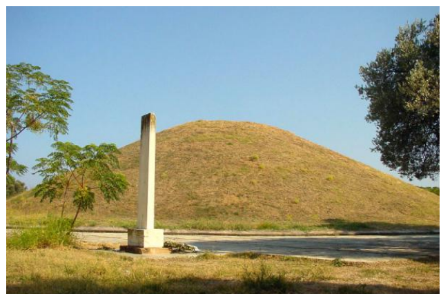
Рис. 1. Тумулус марафонських воїнів

Виклад основного матеріалу. 1. Доархітектурна епоха меморіалізації: від поліандріону до кенотафу. Початковий етап розвитку просторів поховання комбатантів можна охарактеризувати як «доархітектурний», оскільки домінуючою формою виступала не структурована конструкція, а ландшафтний об'єм. У культурі Стародавньої Греції смерть на полі бою героїзувалася, проте ця меморіалізація мала виключно колективний характер. Основною просторовою одиницею виступав поліандріон – специфічна форма братської могили, що візуально вирішувалася як тумулус (земляний насип). Показовим прикладом є поховання марафонських воїнів, де відсутнє розпланування на окремі ділянки (Clairmont, 1983). Архітектори античності формували єдиний монументальний об'єм, що символізував неподільність військової фаланги, затверджуючи примат спільного тіла держави над тілом окремого громадянина.