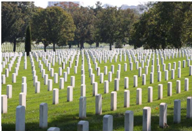
Рис. 4. Арлінгтонське національне кладовище

гробка (вертикальної білої плити із заокругленим верхом). Цей елемент став просторовою маніфестацією егалітаризму: офіцери та рядові отримували однакові маркери, що архітектурно закріплювало концепцію «демократії смерті» (Mosse, 1990). Таким чином, до кінця XIX ст. типологія військового цвинтаря остаточно сформувалася як регулярний ансамбль з уніфікованою системою візуальних знаків.