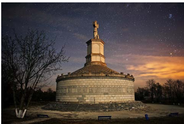
Рис. 2. Трофей Траяна в Адамклісі

Суттєві зміни в парадигму меморіалізації ввела Римська імперія. Професійний характер армії та ведення бойових дій на значних відстанях від метрополії зумовили появу кенотафу – архітектурного об'єкта, який не містив останків, але виконував функцію сакрального місця пам'яті. З містобудівної точки зору, відбувся революційний розрив фізичного зв'язку між тілом загиблого та пам'ятником. Водночас офіційна мілітарна архітектура Риму тяжіла до прославлення тріумфу імператора, а не увічнення жертви рядового легіонера. Це відобразилося у домінуванні типології монументального Трофею (Troaeum), наприклад, Трофею Траяна в Адамклісі.