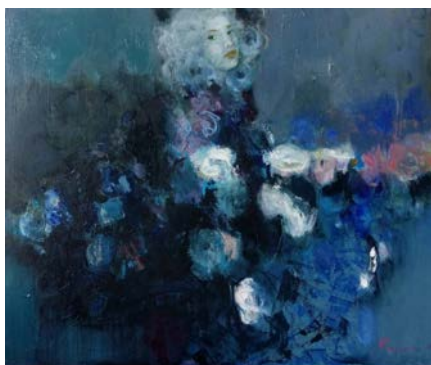
Рис. 5. Н. Резніченко. В синіх квітах. 2020. 80x120