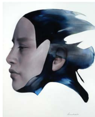
Рис. 6. К. Резніченко. Риба. 2024. 50,8x60,96. Пол., олія