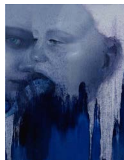
Рис. 7. К. Резніченко. Без назви. 2025. 60,96x76,2. Пол., олія, акрил

Дата першого надходження статті до видання: 02.03.2026 Дата прийняття статті до друку після рецензування: 25.03.2026 Дата публікації (оприлюднення) статті: 19.05.2026