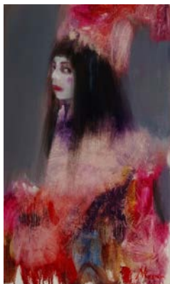
Рис. 4. Н. Резніченко. Престиж. 2019. 80x100